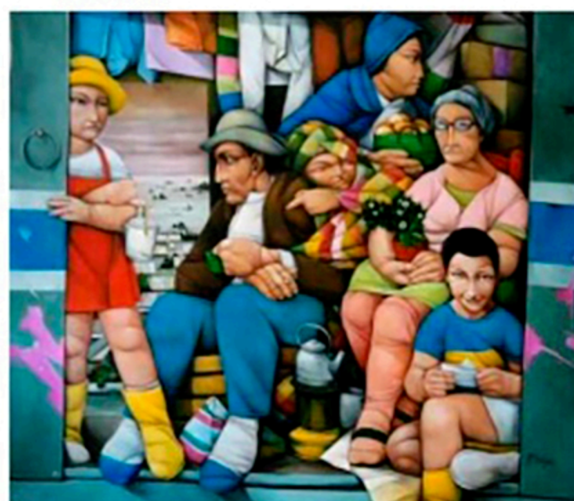
Alluvione , olio su tela, cm 120x140